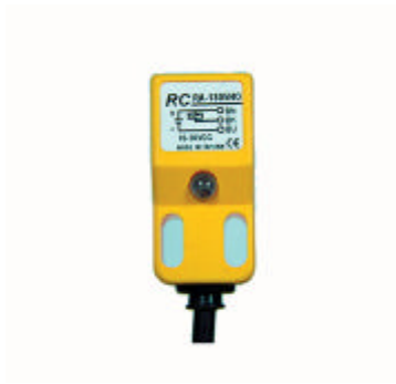
型號 : RA-1805