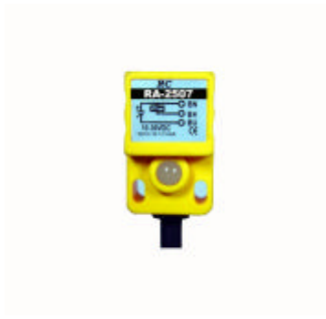
型號 : RA-2507